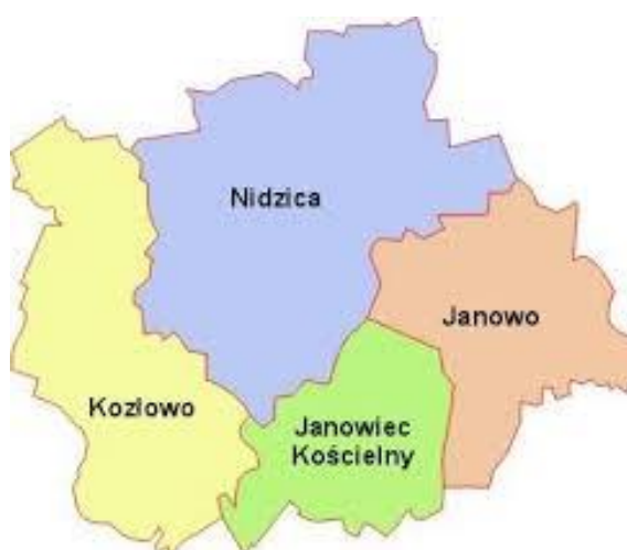
Rysunek – Mapa Powiatu Nidzickiego

W 2018 roku Powiat zamieszkały był przez 33 029 mieszkańców. Siedzibą Powiatu jest Nidzica, miasto położone nad rzeką Nidą (górny bieg Wkry).