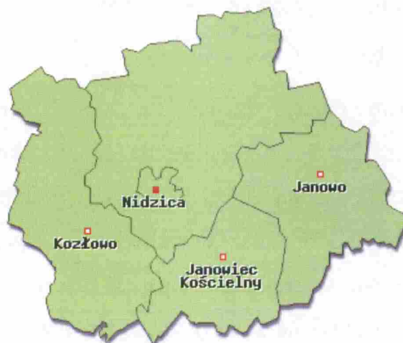
Mapa administracyjna

Zgodnie z danymi uzyskanymi z Powiatowego Zespołu do Spraw Orzekania o Niepełnosprawności w Szczytnie w powiecie nidzickim na dzień 31.12.2013 r. do niepełnosprawnych zakwalifikowano 1.228 osób, z czego 424 stanowiły kobiety i 388 mężczyźni a pozostała liczba tj. 416 dotyczy wydanych orzeczeń o niepełnosprawności dzieciom. Największą liczbę stanowią niepełnosprawni z umiarkowanym stopniem niepełnosprawności – 386 osób. Następnie osoby ze znacznym stopniem niepełnosprawności – 252 i z lekkim - 174. Pozostałe 416 orzeczeń wydano dzieciom do 16 roku życia, którym nie określa się stopnia niepełnosprawności. W 2013 roku wśród osób ubiegających się o wydanie stopnia niepełnosprawności 125 pracowało zawodowo na otwartym rynku pracy natomiast 687 osób było nieaktywnych zawodowo – nie pracujących. Najwięcej schorzeń jakie pojawiły się przy orzekaniu niepełnosprawności były schorzenia dysfunkcji narządu ruchu – 329, układu oddechowego i układu krążenia – 297 oraz schorzenia neurologiczne – 206. W skład powiatu nidzickiego wchodzi cztery ościenne gminy: Gmina Nidzica, gmina Janowo, Gmina Janowiec Kościelny i Gmina Kozłowo. Stan niepełnosprawności w poszczególnych gminach przedstawia się następująco: