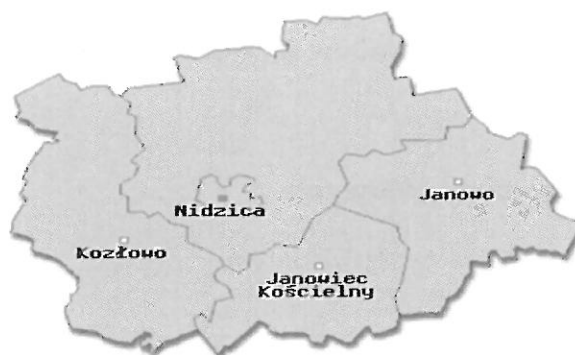
Mapa. Powiat Nidzicki z podziałem na Gminy.

Powiat Nidzicki zamieszkuje 33.432 mieszkańców (stan na dzień 31.12.2016 r. Główny Urząd Statystyczny). W poszczególnych gminach Powiatu Nidzickiego zamieszkuje: w Gminie Nidzica 21.324 mieszkańców, w Gminie Janowiec Kościelny 3.243 mieszkańców, w Gminie Janowo 2.723 mieszkańców, w Gminie Kozłowo 6.142 mieszkańców.