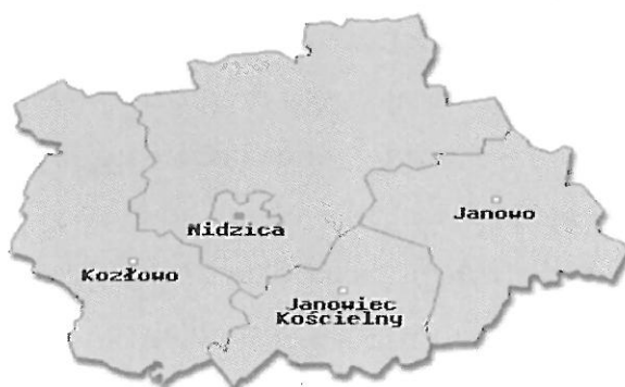
Mapa. Powiat Nidzicki z podziałem na Gminy.

Powiat Nidzicki należy geograficznie do obszaru Pojezierza Mazurskiego. Położony jest w południowej części województwa warmińsko-mazurskiego, na granicy z województwem mazowieckim. W jego skład wchodzi cztery gminy: Kozłowo, Janowiec Kościelny, Janowo oraz Nidzica, a łączna powierzchnia wynosi 961 km 2 . Powiat zamieszkuje 33.432 osób, z czego 21.324 to mieszkańcy Gminy i Miasta