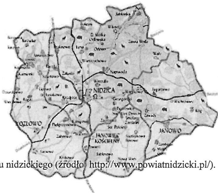
Rys. 1 Mapa powiatu nidzickiego.

Powiat Nidzicki geograficznie należy do obszaru Pojezierza Mazurskiego. Położony jest w południowej części województwa warmińsko-mazurskiego, na granicy z województwem mazowieckim. W jego skład wchodzi cztery gminy: Kozłowo, Janowiec Kościelny, Janowo oraz Nidzica, a łączna powierzchnia wynosi 961 km 2 . Według danych GUS na dzień 31.12.2015 r. powiat zamieszkuje 33658 osób, z czego 14166 osób w samym mieście Nidzica. W skład powiatu wchodzi 165 jednostek osadniczych, z których 103 to wsie sołeckie. Średnia gęstość zaludnienia wynosi 35 osób na 1 km 2 . Siedzibą Powiatu jest miasto Nidzica.