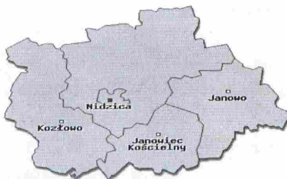
Mapa. Powiat Nidzicki z podziałem na Gminy.

Powiat Nidzicki zamieszkuje 34 271 mieszkańców w tym 17 188 kobiet i 17 083 mężczyzn (stan na dzień 31.12.2011 r. Główny Urząd Statystyczny). W poszczególnych gminach Powiatu Nidzickiego zamieszkuje: w Gminie Nidzica 21 670 mieszkańców w tym 10 980 kobiet i 10 690 mężczyzn, w Gminie Janowiec Kościelny 3 395 mieszkańców w tym 1 649 kobiet i 1 746 mężczyzn, w Gminie Janowo 2 881 mieszkańców w tym 1 454 kobiet i 1 427 mężczyzn, w Gminie Kozłowo 6 325 mieszkańców w tym 3 105 kobiet i 3 220 mężczyzn.